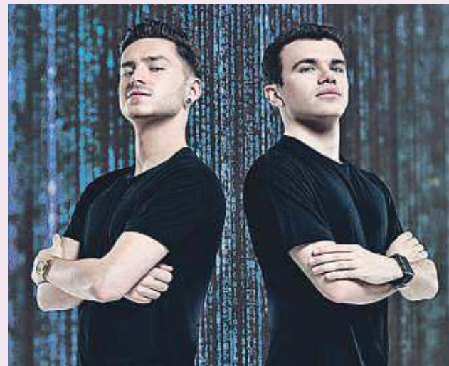
Per a aquest parell, màgia i tecnologia venen a ser el mateix.