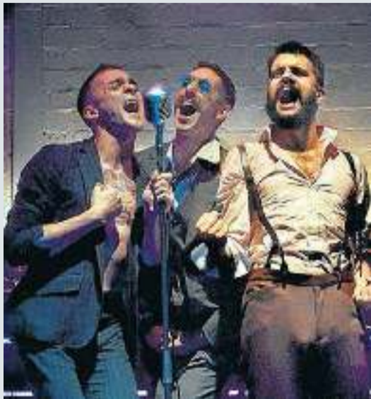
Una escena de Nit de reis (o el que vulguis) , del Teatre Lliure.