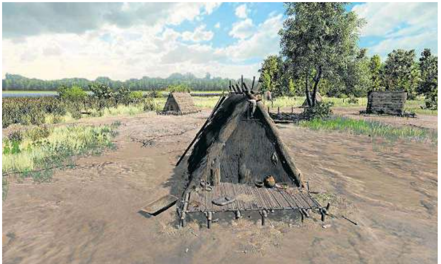
Una de les imatges de la recreació virtual de la Draga que ha fet l'Institut d'Investigació en Intel·ligència Artificial.