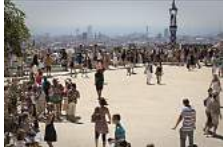
La tragedia del parque Güell, segunda parte