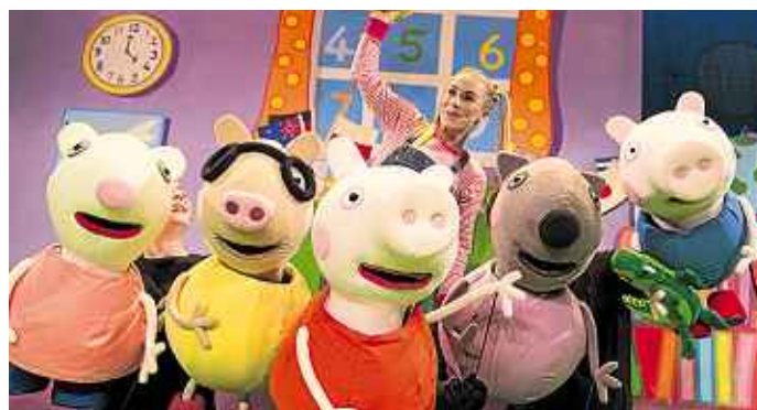
Peppa Pig i els seus companys d'aventures.

És el que tenen les festes nadalènques: els nens es fan més que mai els reis de la casa i els protagonistes de tot. Tant és així, que aquesta setmana els més petits –estem parlant d'un espectacle especialment pensat per a criatures d'entre tres i sis anys – fins i tot s'han escolat a la secció de teatre per a adults per presentar-nos un dels seus personatges més estimats. I és que, i amb el permís de la veterana, glamurosa i insubstituïble Peggy de Sesame Street (ella sempre tindrà un lloc d'honor al nostre cor entre els representants de la raça porcina), la petita Peppa Pig s'ha transformat en una veritable reina del món de l'espectacle des que va fer la seva primera aparició a la tele com a dibuix animat el 2004.